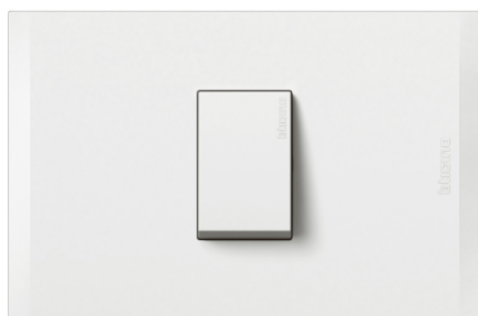
Interruptor sencillo unipolar 15A